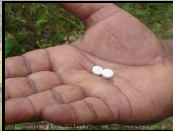
සතිශතට වරක් ආරක්ෂිත ප්‍රතිකාර ගැනීම