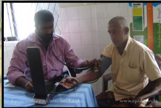
වෛද්‍යවරයෙක් රෝගියෙක් පරීක්ෂා කිරීම