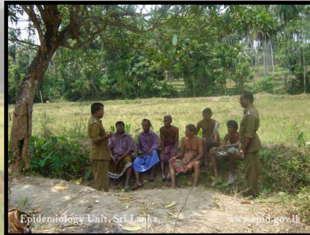
මහජන සෞඛ්‍ය පරීක්ෂක සමග සාකච්ඡාවක්